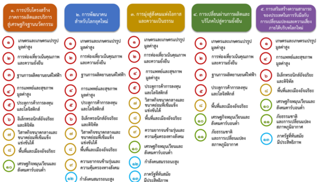
แผนภาพที่ ๓.๑ ความเชื่อมโยงระหว่างหมวดหมู่การพัฒนาเป้าหมายหลัก

ความเชื่อมโยงระหว่างหมวดหมู่การพัฒนาเป้าหมายหลักแสดงไว้ในแผนภาพที่ ๓.๑ โดยหมวดหมู่การพัฒนาที่กำหนดขึ้นเป็นประเด็นที่มีลักษณะเชิงบูรณาการที่ครอบคลุมการพัฒนา ตั้งแต่ในระดับต้นน้ำจนถึงปลายน้ำ และสามารถนำไปสู่ผลพัฒนาทั้งในมิติเศรษฐกิจ สังคม ทรัพยากรธรรมชาติและสิ่งแวดล้อมไปพร้อม ๆ กัน ทำให้หมวดหมู่แต่ละประการสามารถสนับสนุนเป้าหมายหลักได้มากกว่าหนึ่งข้อ นอกจากนี้การพัฒนาภายใต้แต่ละหมวดหมู่ไม่ได้แยกขาดจากกัน แต่มีการสนับสนุน หรือเอื้อประโยชน์ซึ่งกันและกัน